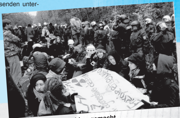
Schiene wird unbrauchbar gemacht

dem Gleisbett, den Castor blockieren. Um auf die Strecke zu kommen werden wir gemeinsam Polizeiabsperungen überwinden, umgehen oder durch sie hindurchfließen. Wir lassen uns nicht stoppen. Ziel unserer Aktion ist, die Schiene unbrauchbar zu machen und nicht, die Polizei anzugreifen. Unser wichtigster Schutz ist, die massenhafte Beteiligung, unsere Vielfalt und Entschlossenheit. Während tausende Schottern, werden andere durch Sitz- und Stehblockaden verhindern, dass Einzelne herausgegriffen werden, oder die Aktion mit körperschützenden Materialien wie Polstern, Luftmatratzen oder Planen schützen. Wir bleiben so lange auf der Schiene bis diese unbefahrbar ist."